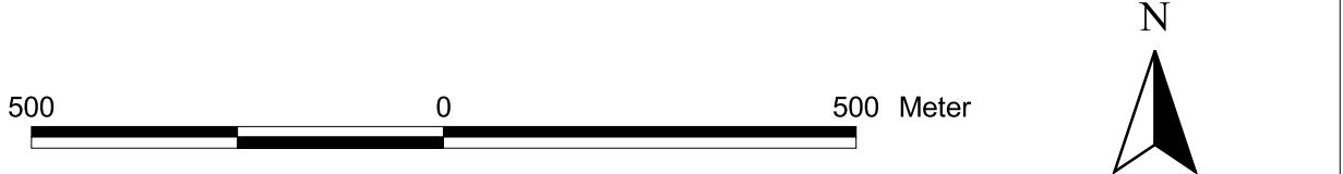
Übersichtskarte zur Lage der Teilflächen

Waldeinteilung auf der Grundlage der Forstgrundkarte der Forstbezirke Bärenfels und Neustadt (Quelle: SBS)